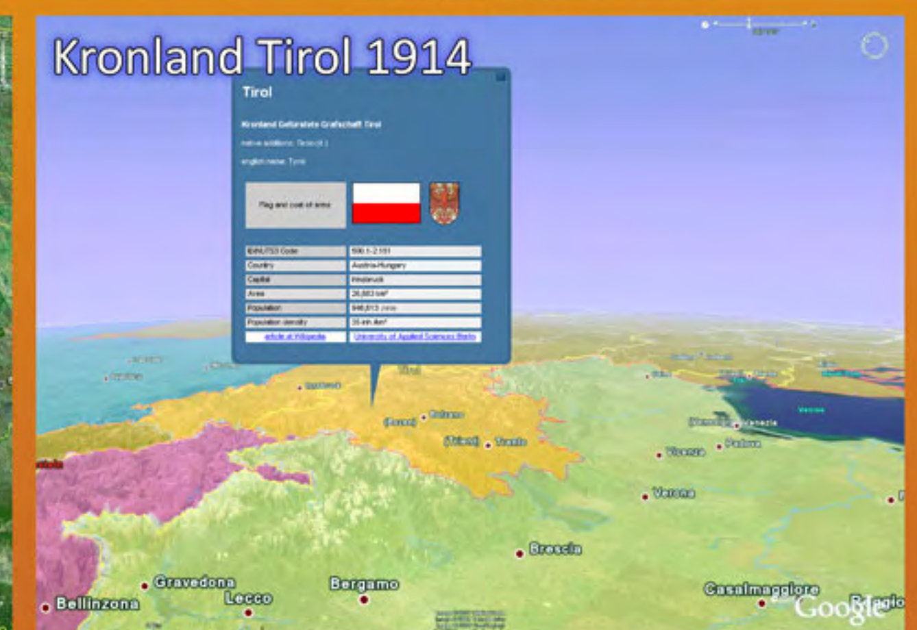
Kronland Tirol 1914