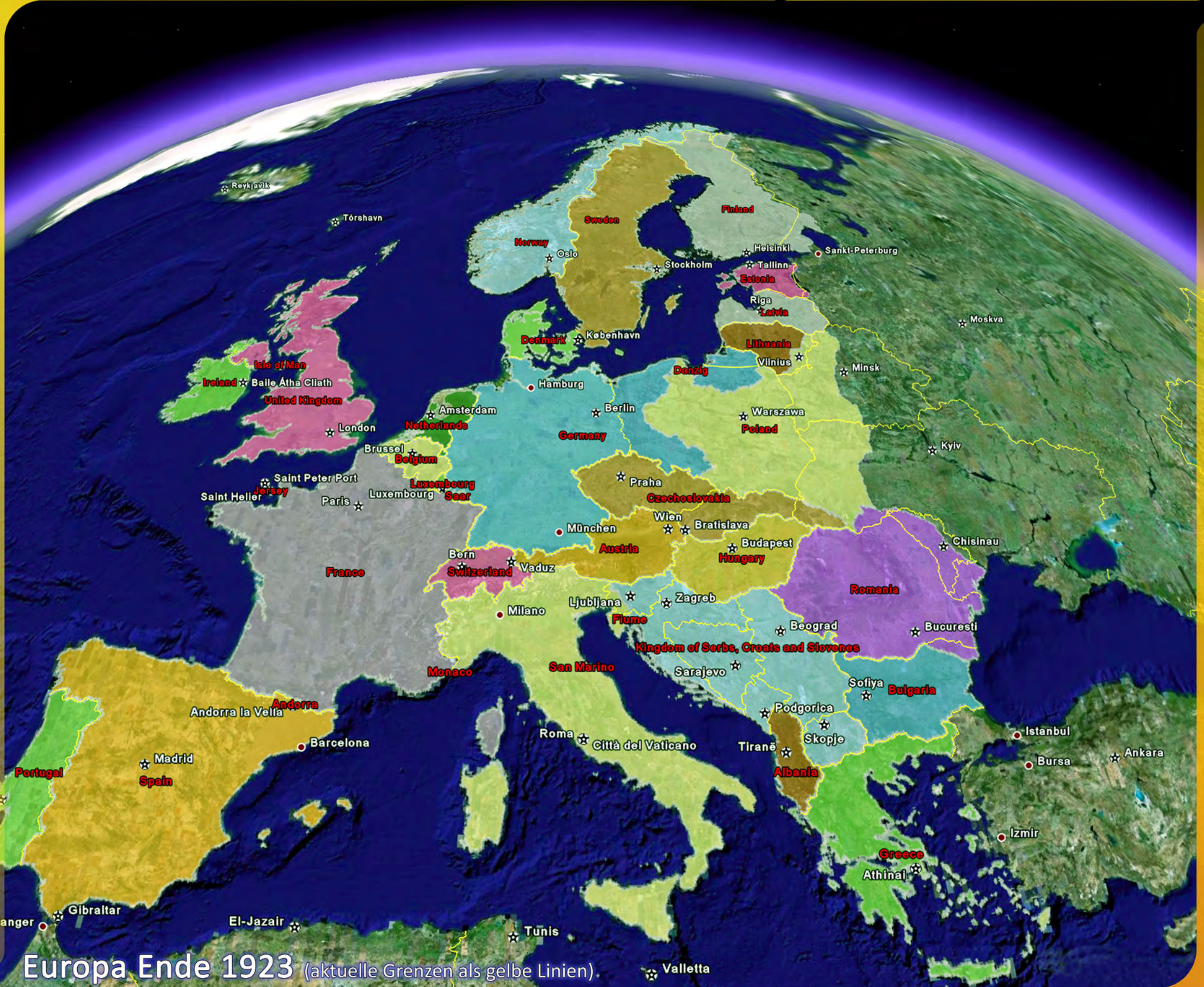
Europa Ende 1923 (aktuelle Grenzen als gelbe Linien)

Per Mausklick auf eine Verwaltungseinheit erhält der Anwender von REGIS:GE Zusatzinformationen für den dargestellten Zeitpunkt. In einem Infofenster wird der Name der Einheit, deren Flächengröße, die Bevölkerungszahl und die Bevölkerungsdichte angezeigt. Die Zuordnung zu einem administrativen Level ist der Auflistung ebenso zu entnehmen, wie der Name der Hauptstadt der Einheit. Auch die zugehörige Flagge sowie das Wappen der Verwaltungseinheit werden dargestellt.